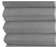
Stålgrå insida vit utsida