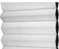
Vit in- och utsida

Bildernas tryckfärger är endast vägledande och kan avvika mot produkterna