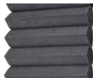
Stålgrå insida vit utsida