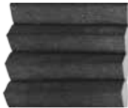
Grafitgrå insida vit utsida