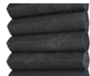
Grafitgrå insida vit utsida